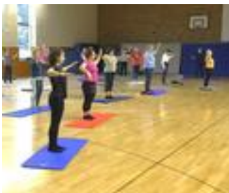
Frauen Fitness Fun Seite 9