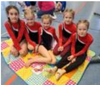
Turnen Seite 21